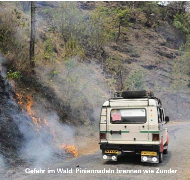
Gefahr im Wald: Piniennadeln brennen wie Zunder