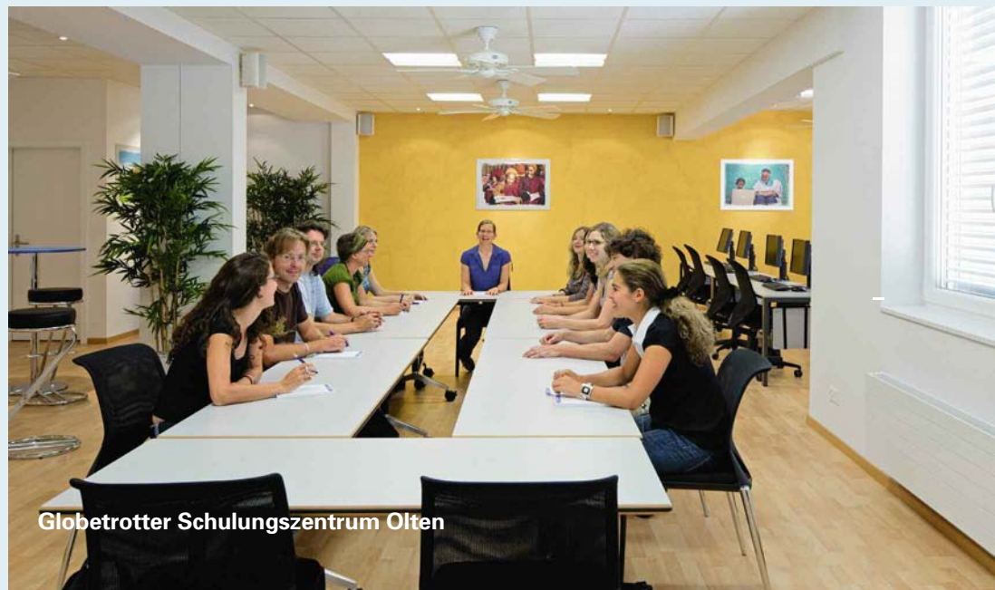
Globetrotter Schulungszentrum Olten