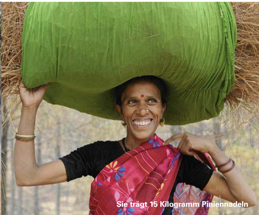
Sie trägt 15 Kilogramm Piniennadeln

der Verwertung. Und tatsächlich: Im grössten gedeckten Raum der Fabrik steht eine neue Brikettmaschine – unsere!