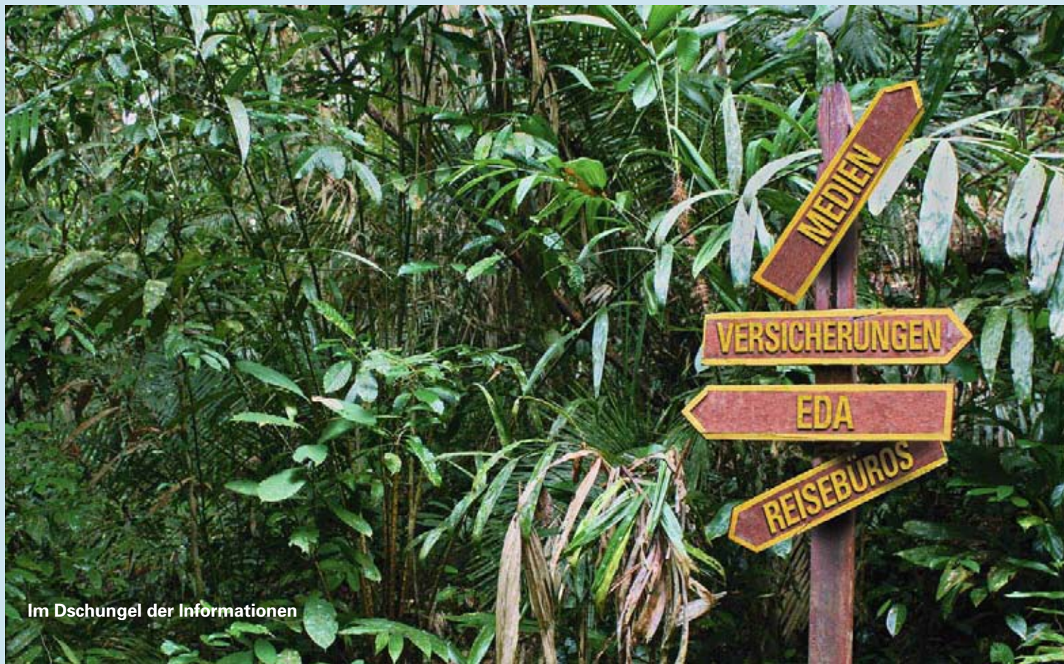
Im Dschungel der Informationen

Für Individualreisende, die nicht unter das Pauschalreisegesetz fallen und die selbst entscheiden müssen, ist es schwieriger, gute Informationen zu beschaffen. Die EDA-Teilstücke helfen nicht immer weiter. Beispiel Indonesien, Stand 1. August 2009: «Die politische Lage im Land ist grundsätzlich ruhig und stabil. (...) Zwischen 2002 und 2005 wurden in Indonesien mehrere Terroranschläge verübt,