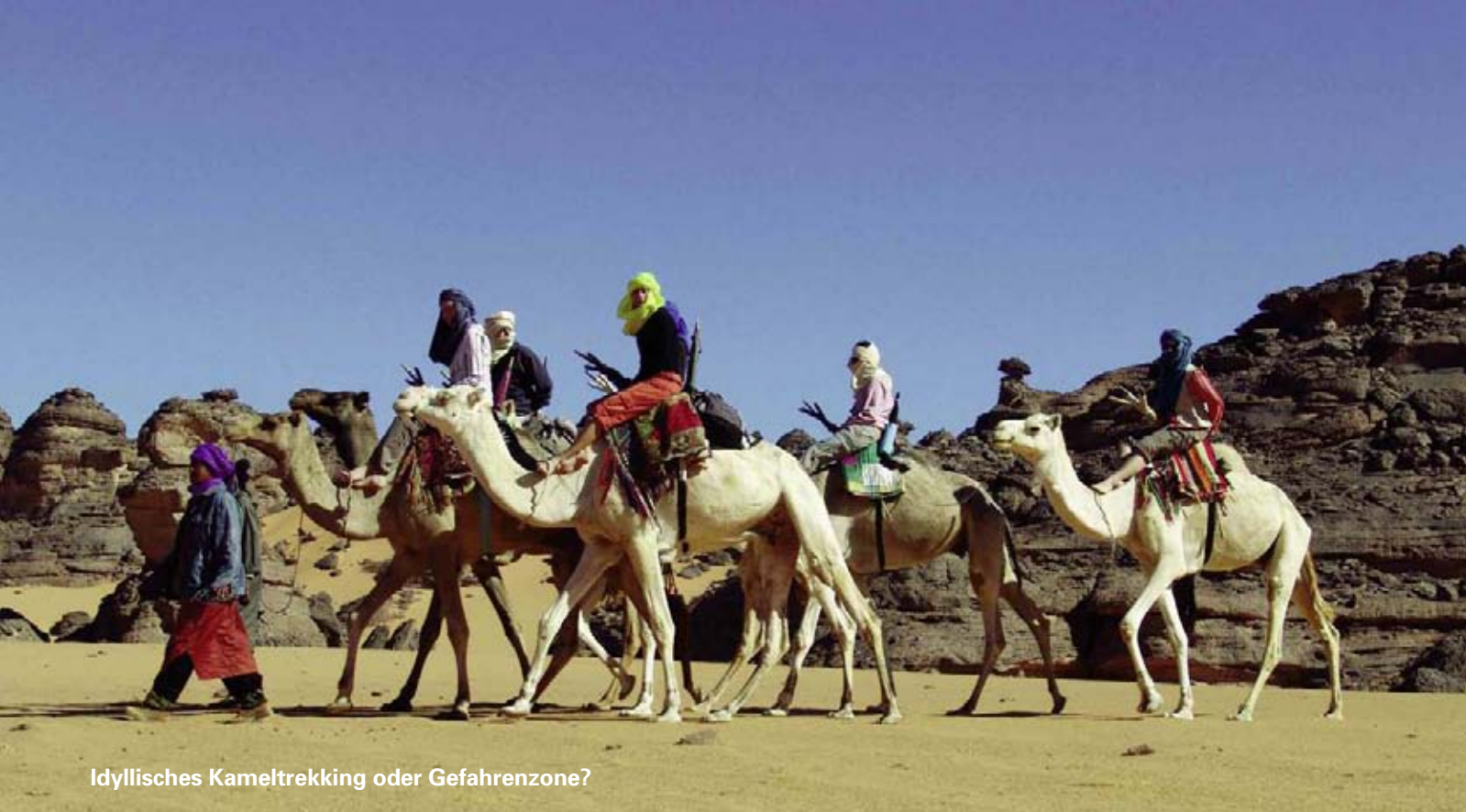
Idyllisches Kameltrekking oder Gefahrenzone?

unter anderem in Jakarta und auf Bali. Am 17. Juli 2009 sind in Jakarta zwei Bombenanschläge auf internationale Hotels verübt worden. Sie forderten mehrere Todesopfer und Verletzte. Auch weiterhin ist im ganzen Land mit Attentaten zu rechnen.» Hinfliegen oder zu Hause bleiben?