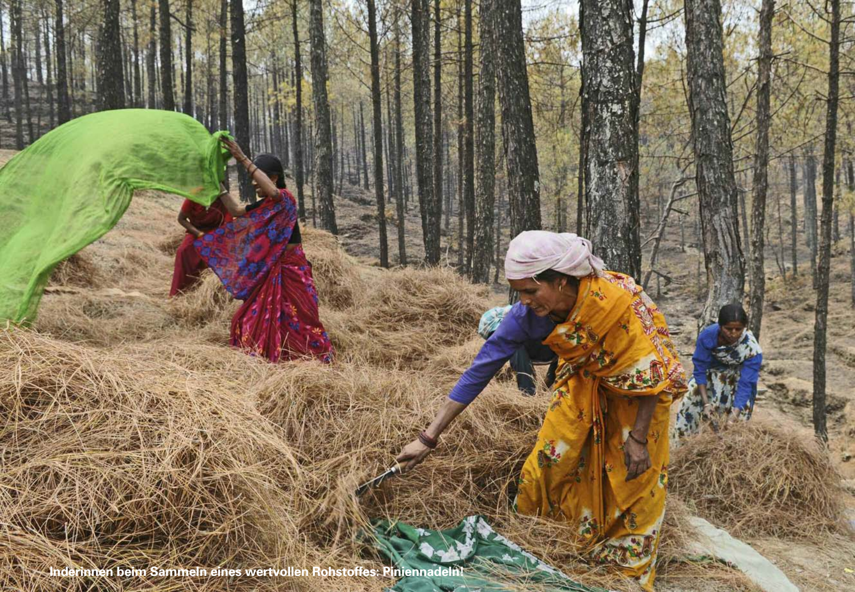
Indierinnen beim Sammeln eines wertvollen Rohstoffes: Piniennadeln!

zum Klimaschutz zu leisten. Dazu gründete er die lokale Organisation «Rural Renewable Urja Solutions» (RRUS). Urja bedeutet Energie. Die RRUS mit Sitz in Dehradun, der Hauptstadt von Uttarakhand, organisiert das Einsammeln der Biomasse, produziert die Briketts und verkauft sie. Kunden sollen jene Firmen werden, die zur Herstellung von Tonziegeln und Stabeisen bislang Kohle verheizten. Sukzessive soll diese Kohle durch klimaneutrale Briketts ersetzt werden. Doch das RRUS-Projekt geht noch einen Schritt weiter: Es produziert neue, effiziente Kocher für Restaurants, Tempel, Tageschulen und Krankenhäuser. Diese Kocher werden mit Biomassebriketts befeuert. Dabei entsteht kein stickiger Rauch wie bei den herkömmlichen Kochmethoden. Der beissende Kerosingeruch entfällt ebenfalls und die Unfallgefahr im Umgang mit Flüssiggas ist eliminiert. Die Kocher verbrauchen nur halb so viel Brennstoff wie die hier handelsüblichen.