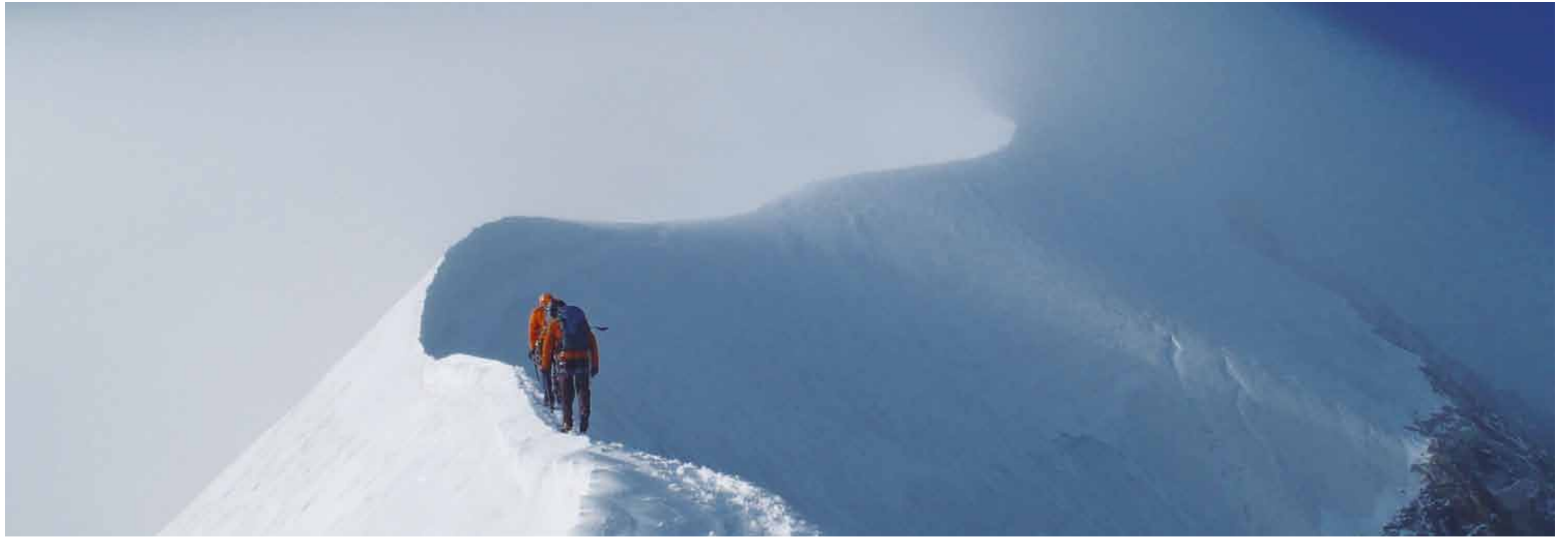
▲ Sportliche Ziele sind wichtig: Überschreitung des Biancograts (Bernina).

ausforderungen – genau so wie im Sommer der eine oder andere Marathon. «Er braucht auch da Ziele», sagt seine Frau. «Allein wegen der Natur oder dem Vogelgezwitscher geht er nicht zum Joggen an die Aare.»