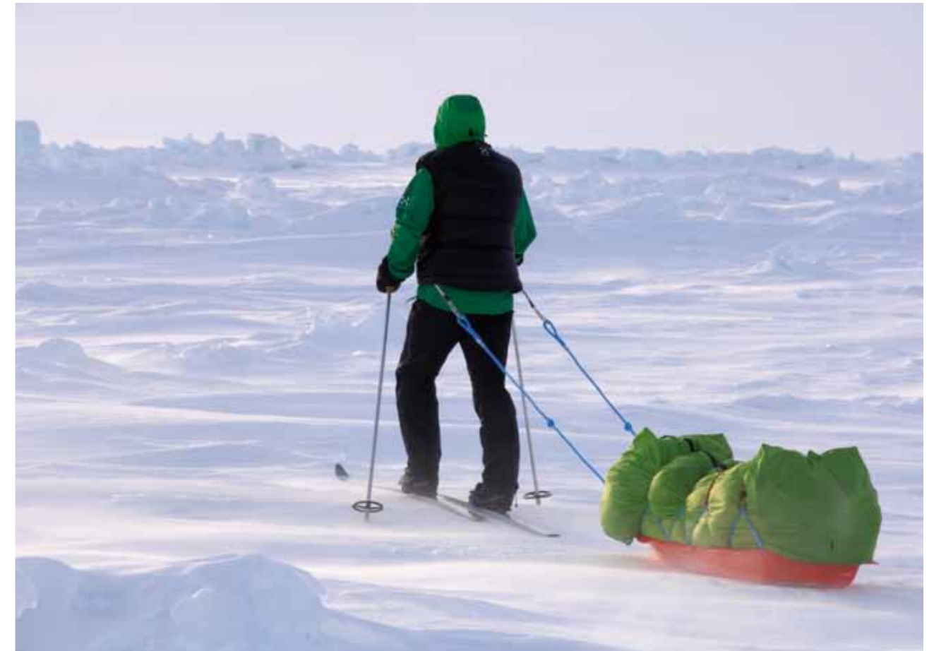
▲ Der Outdoor-Sport als Tummelfeld: 2007 erkundete der Globetrotter-Chef den Nordpol.

Seine jüngsten Projekte haben immer den Anstrich des Ungewöhnlichen. 2007 war er mit dem Fotografen Thomas Ulrich am Nordpol, schleppte einen 29 Kilo